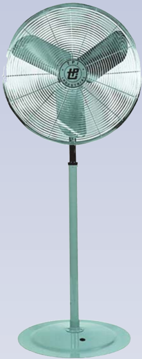
A Ventilateur sur colonne