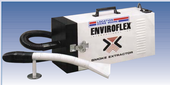
D Purificateur d'air portatif