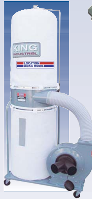
E Collecteur de poussière