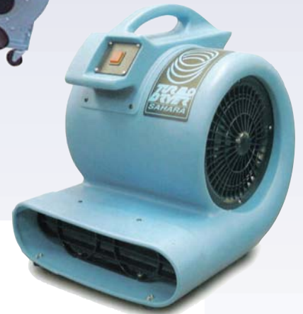
G Assécheur de tapis