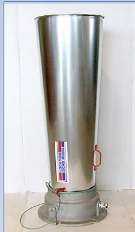
B Ventilateur type Venturi