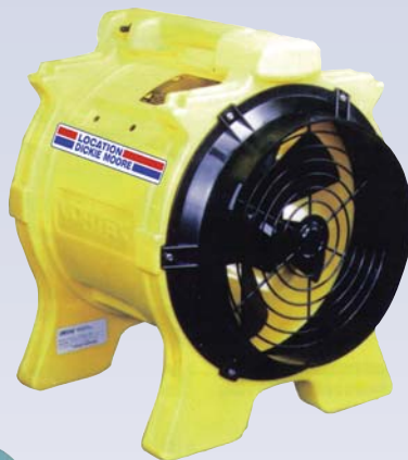
D Ventilateur - 12"