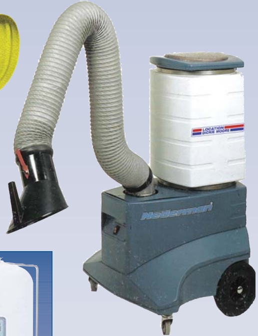
C Purificateur d'air