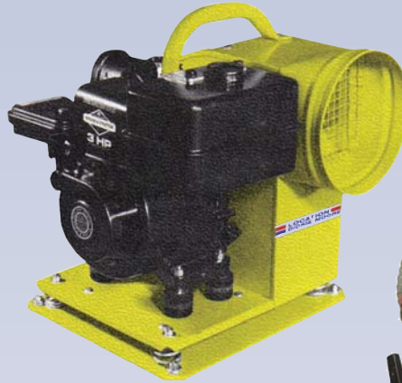
B Ventilateur à essence