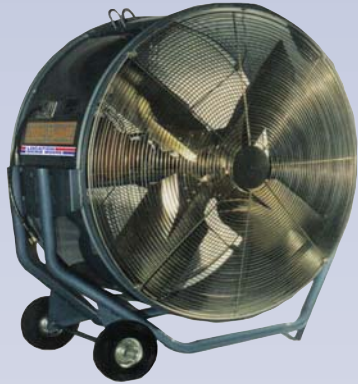
A Ventilateur - 42"