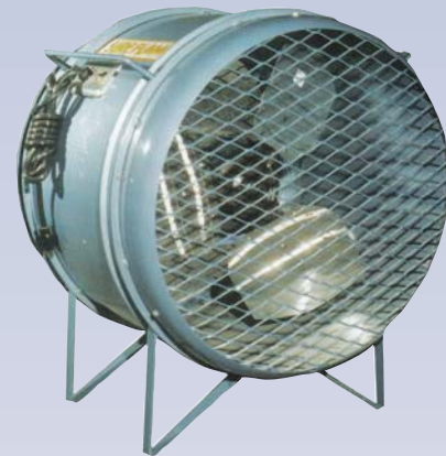
C Ventilateur - 22"