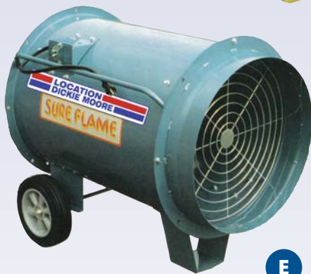
E Ventilateur - 18"