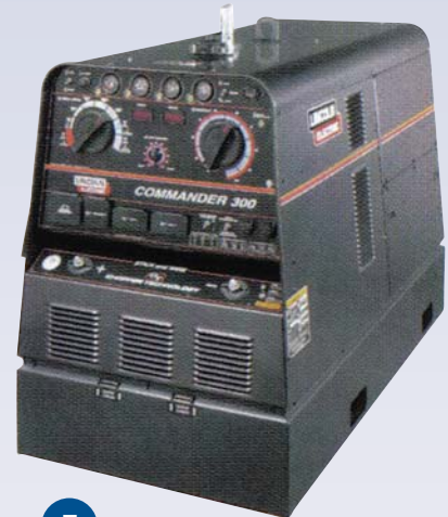
F Soudeuse au diesel