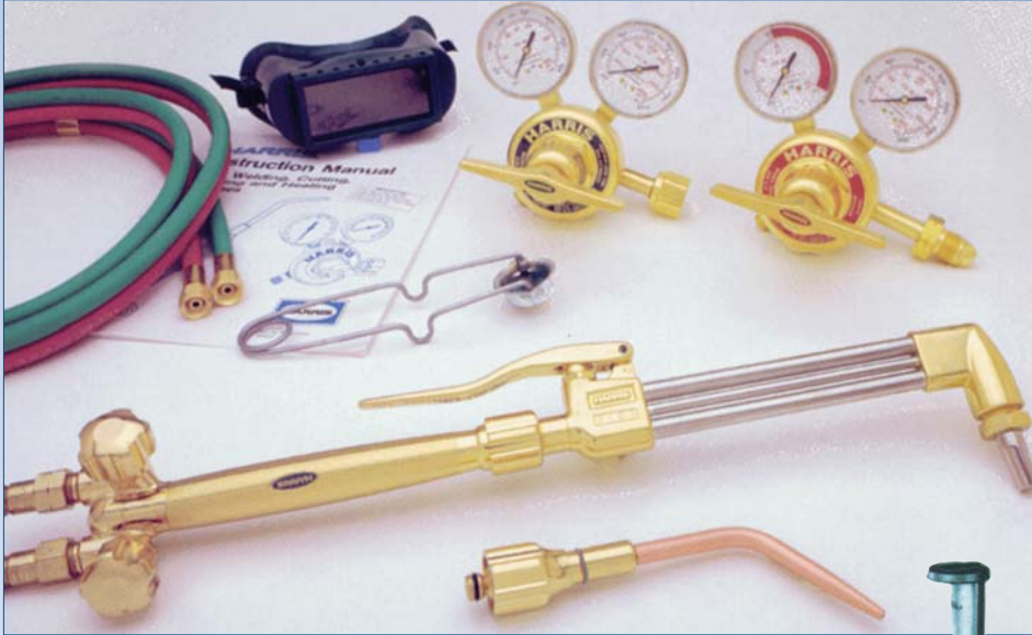
A Équipement à souder/couper au gaz