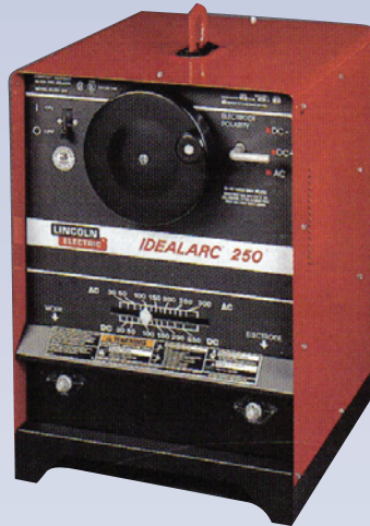
B Soudeuse électrique