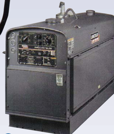
E Soudeuse au diesel