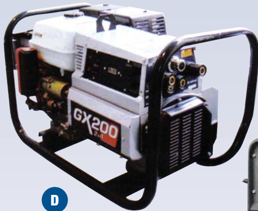
D Soudeuse à essence