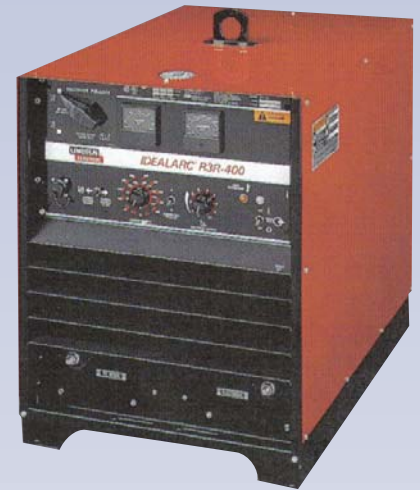
C Soudeuse électrique