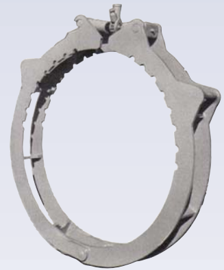
G Serre d'alignement