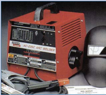
A Soudeuse électrique