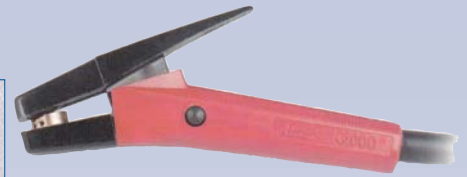
B Équipement à gouger