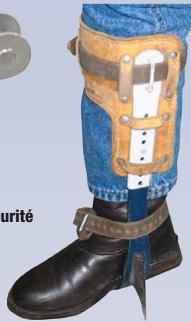
C Crampons pour poseur de ligne