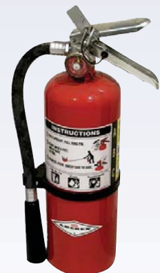
J Extincteur d'incendie