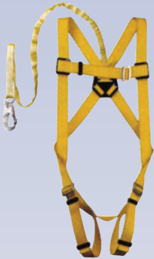
A Harnais de sécurité (avec câble absorbeur)