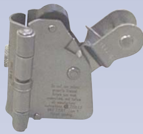
B Coulisseau de sécurité