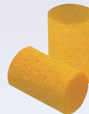
I Bouchons auditifs