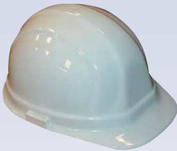
E Casque de sécurité