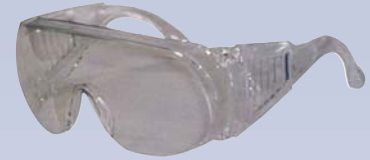
D Lunettes protectrices