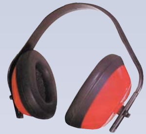
H Protecteur auditif