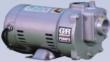
A Pompe centrifuge