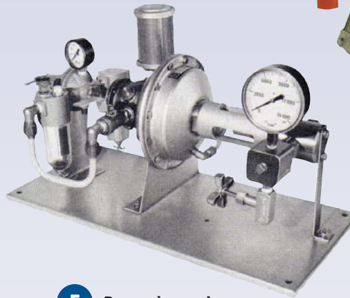
F Pompe à pression