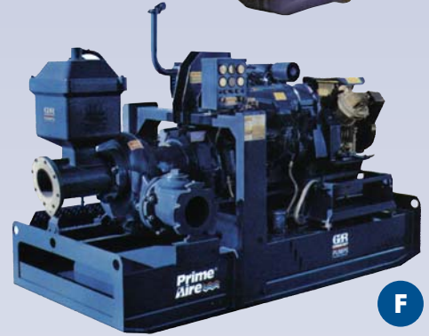
F Pompe à rebut - amorcement assisté