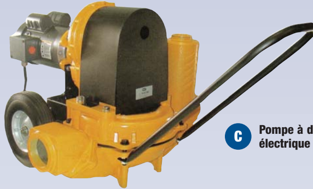
C Pompe à diaphragme électrique