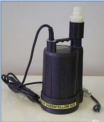
A Pompe à toiture