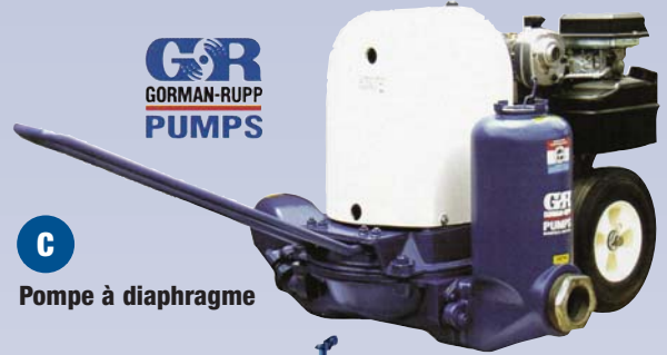
C Pompe à diaphragme