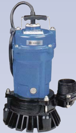
B Pompe submersible à rebut