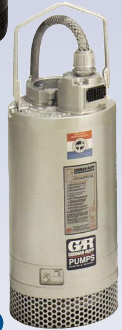
F Pompe submersible