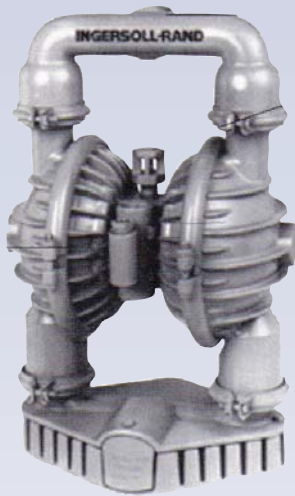
D Pompe à diaphragme pneumatique