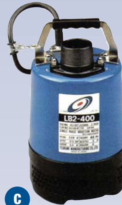
C Pompe submersible