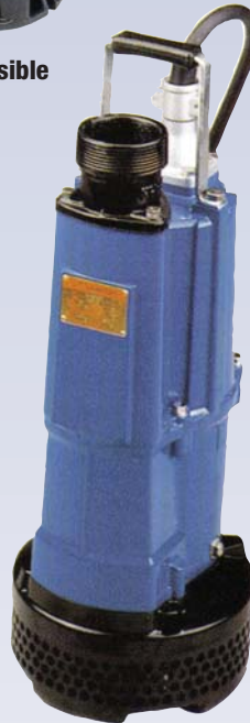
E Pompe submersible