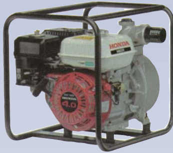
B Pompe centrifuge