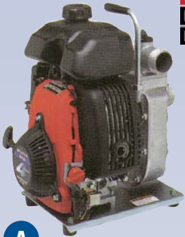
A Pompe centrifuge