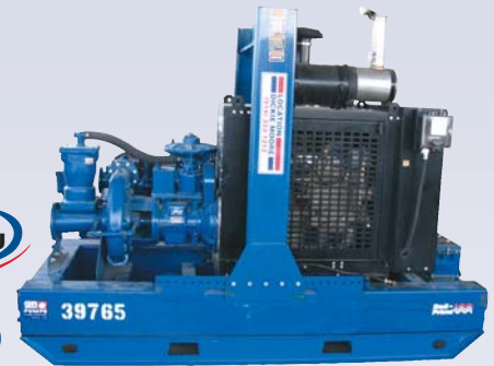
H Pompe à rebut - amorcement assisté