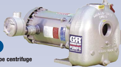
B Pompe centrifuge