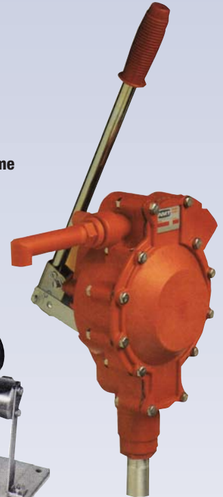
G Pompe à baril manuel