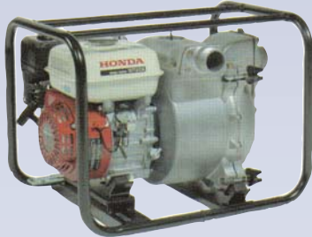
D Pompe à rebut