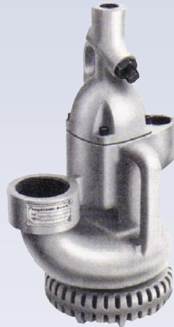
E Pompe submersible pneumatique