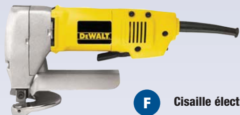
F Cisaille électrique