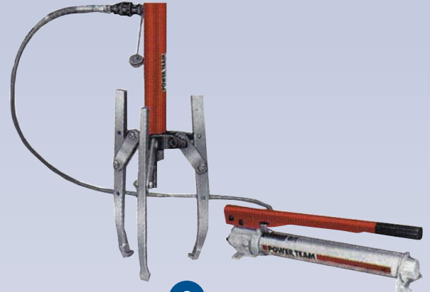
Arrache-coussinets - Manuel