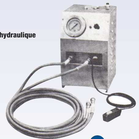
Clef dynamométrique hydraulique