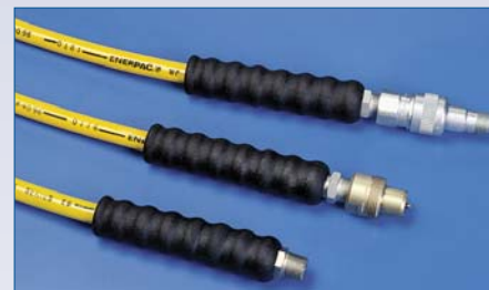
H Boyau haute-pression