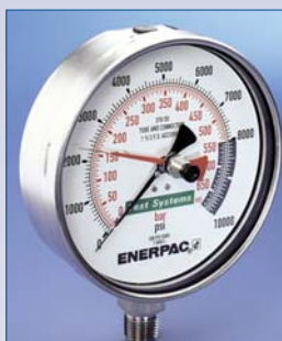
E Manomètre hydraulique