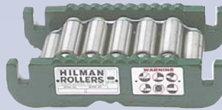
C Rouleau à machinerie