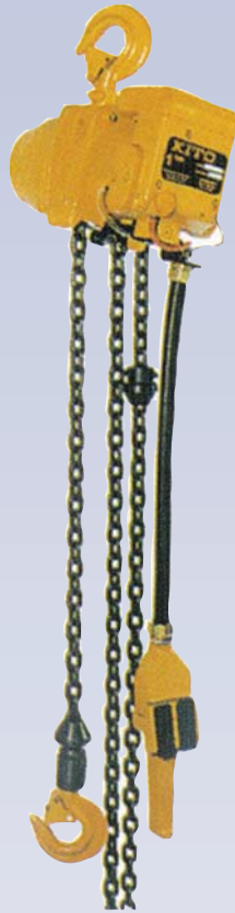
B Palan à chaîne électrique