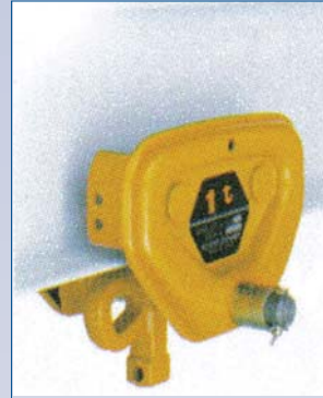
C Chariot manuel