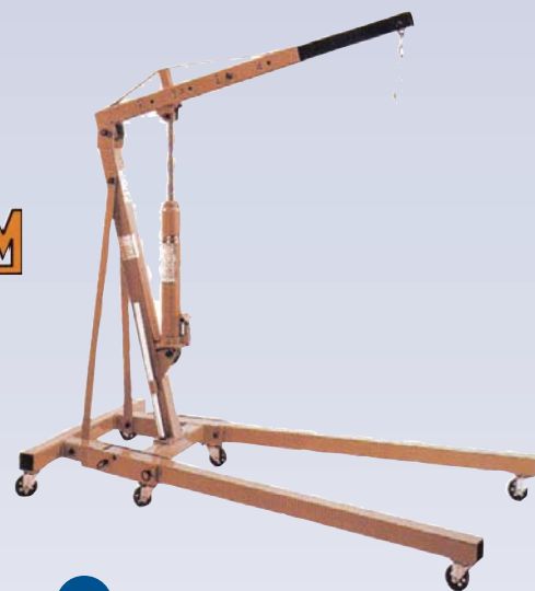
F Grue portative - 1000 lbs