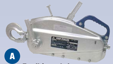
A Treuil à machoir