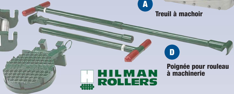
D Poignée pour rouleau à machinerie