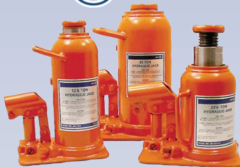
A Vérin hydraulique