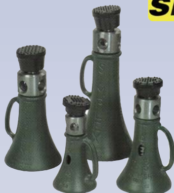
A Crics à vis

SIMPLEX A Division Of Ferguson, Kelly & Co., Inc.