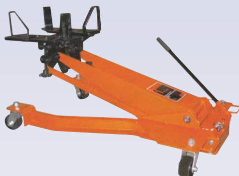
E Cric à transmission