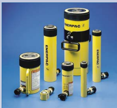
B Cylindre hydraulique