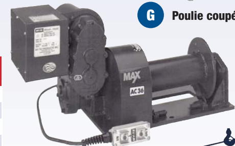
H Treuil électrique