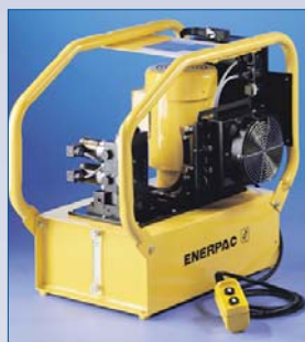
D Pompe hydraulique électrique