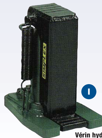
I Vérin hydraulique à patte de relevage