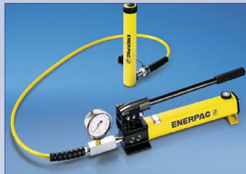
C Pompe hydraulique manuelle