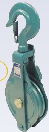
G Poulie coupée