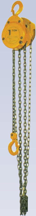
A Palan à chaîne