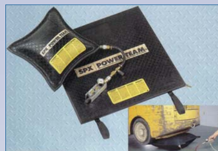
C Cric gonflable