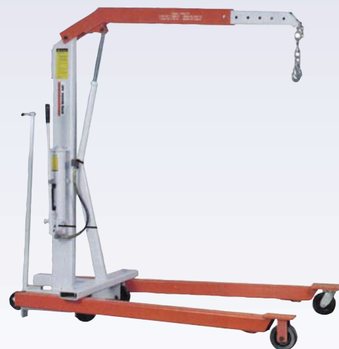
G Grue portative - 4000 lbs