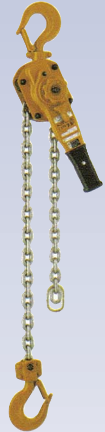
D Treuil à levier