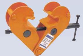
E Grappin à poutre