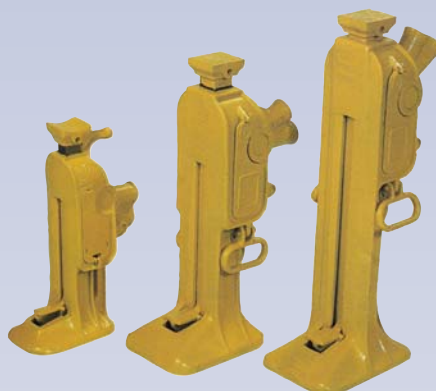
B Crics mécaniques