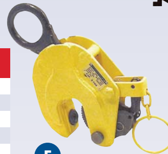
F Grappin à plaque