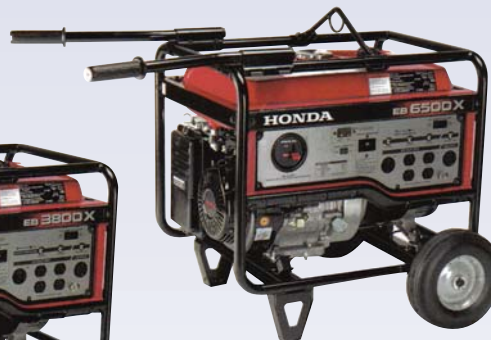
C Génératrice - 6500W