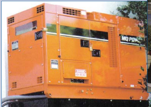
A Génératrice 12KW