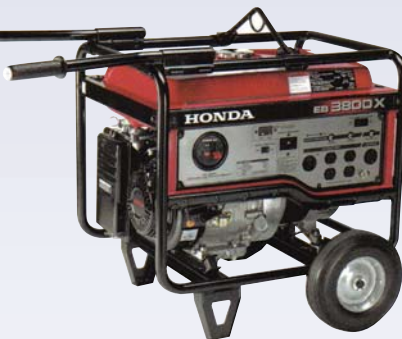
B Génératrice - 3800W