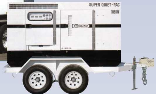
C Génératrice 105KW