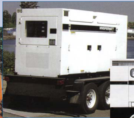
B Génératrice 35KW