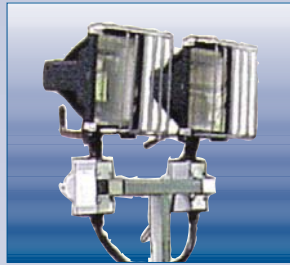
Projecteur portatif - 2X500W