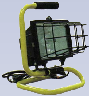
A Projecteur portatif - 500W