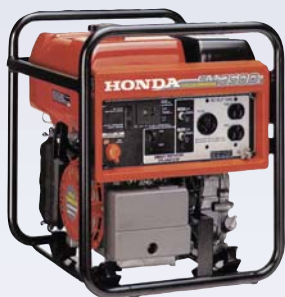
A Génératrice - 2500W