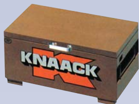
A Coffre à outils - 30"