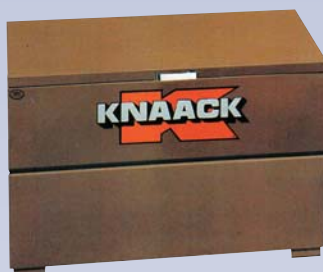
B Coffre à outils - 48"