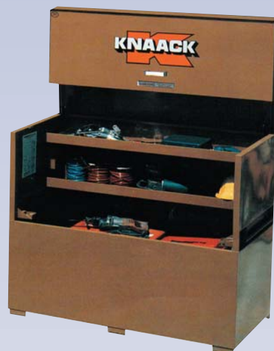
C Coffre à outils - 60"