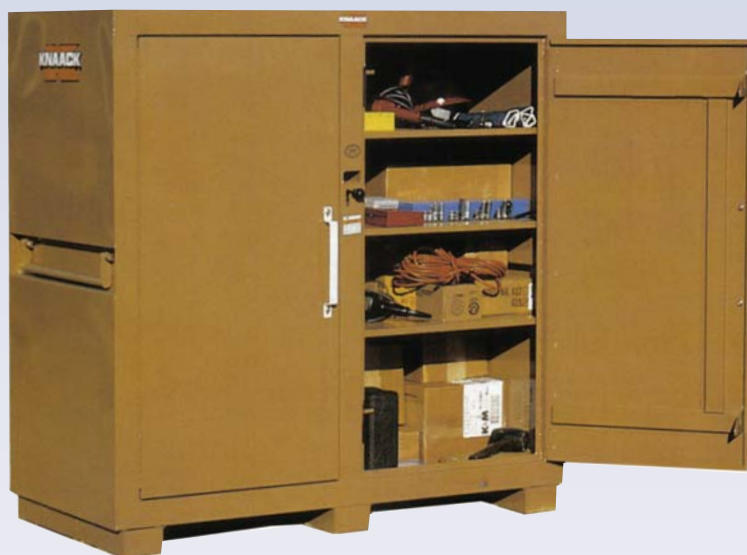
E Cabinet à outils