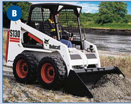
Chargeur - 1300 lbs