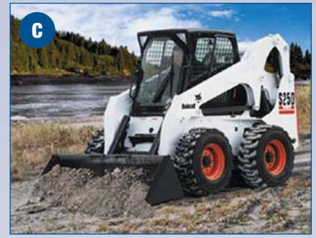
Chargeur - 2500 lbs