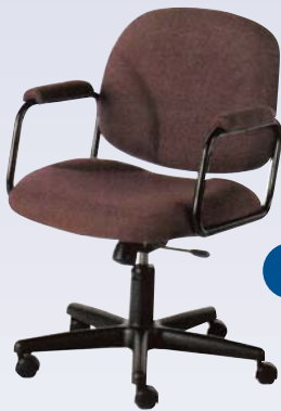
E Chaise pivotante